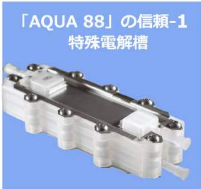
「AQUA 88」の信頼-1 特殊電解槽 「AQUA 88」は、効果があると言われる溶存水素濃度0.6ppm以上を約8時間持続