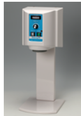
スタンド式(オプション)