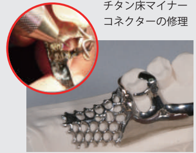
チタン床マイナー コネクターの修理