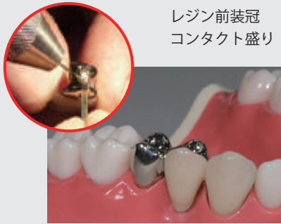
レジン前装冠 コンタクト盛り