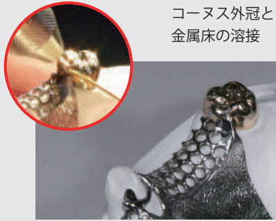
コーヌス外冠と 金属床の溶接