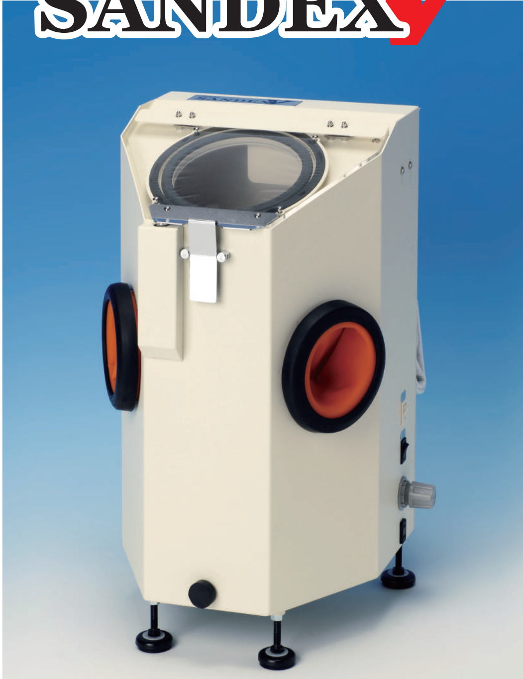
金属床用循環式サンドブラスター