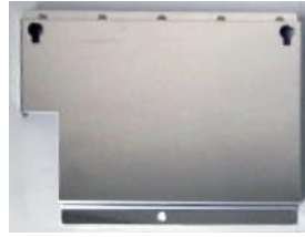
壁掛けハンガー（別売）