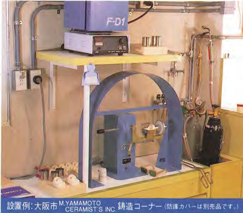
設置例: 大阪市 M.YAMAMOTO CERAMIST'S INC. 鑄造コーナー (防護カバーは別売品です。)

陶材焼付用合金はプレシャス合金から始まり、ノンプレシャス合金を経てセミプレシャス合金へと変遷しています。