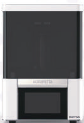
Industrial-grade 3D printers