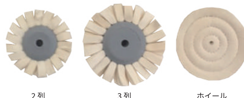
2列 3列 ホイール

一般的名称：歯科用研磨器材 分類：クラスⅠ 許可 / 届出番号：27B2X00306A00002 各 1 個入