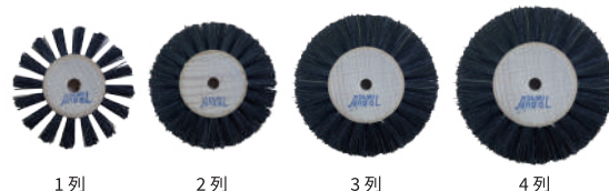
1列 2列 3列 4列

一般的名称：歯科用研磨器材 分類：クラスⅠ 許可 / 届出番号：27B2X00306C00001 ブラシ：豚毛 各 12 個入