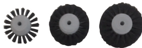
1列 2列 3列

一般的名称：歯科用研磨器材 分類：クラスⅠ 許可 / 届出番号：27B2X00306A00001 ブラシ：豚毛 各 12 個入